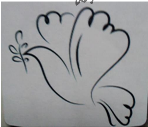
شكل (٦) تحوير خطي لوحدة زخرفية (لطائر)

٨- يوضح شكل (٦) الذي امامك نوع من أنواع التحوير: